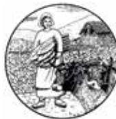
ASSOCIACIÓ DE PAGESOS I RAMADERS D'ANDORRA