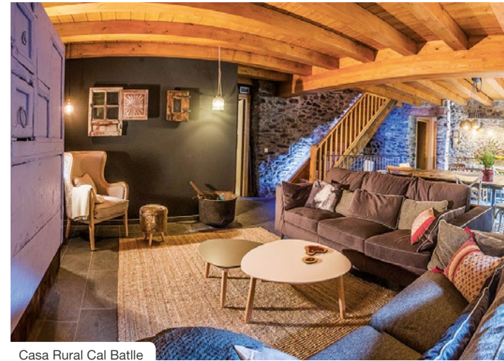
Casa Rural Cal Batlle