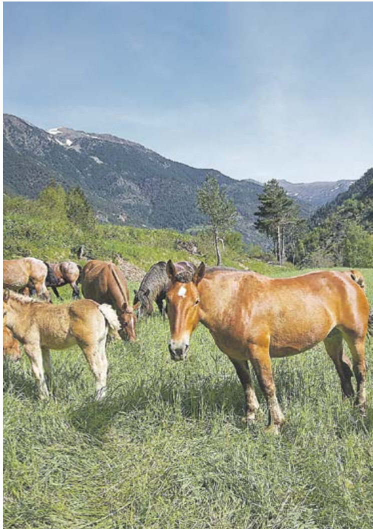
Imatge de les eugues de cal Fijat a Ansalonga.

La col·laboració de la Carnisseria dels Pirineus d'Escaldes permet oferir el producte en lots amb la carn tallada i presentada de diverses maneres, com ara entrecots, bistecs, xurrasco, hamburgueses i carn picada, entre d'altres. Aquest és un dels establiments comercials on ja es pot comprar Poltrand, que també es pot començar a trobar en alguns supermercats i restaurants. Un projecte d'emprenedoria a Ordino que aporta valor afegit.