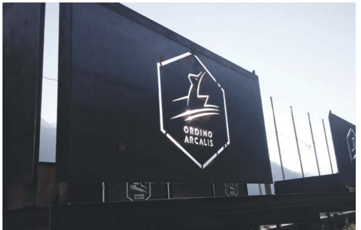
Ordino Arcalís recupera el logotip amb l'isard, la primera imatge comercial del camp de neu.