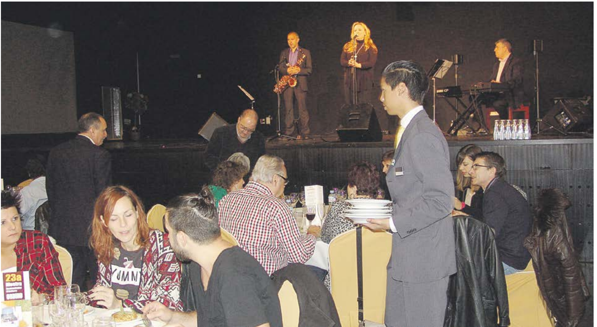
Imatge de la Mostra Gastronòmica en l'edició passada, que va incorporar música en directe, a l'Andorra Congrès Centre Ordino.

AJUDA'NS A RECONSTRUIR LA HISTÒRIA D'ORDINO