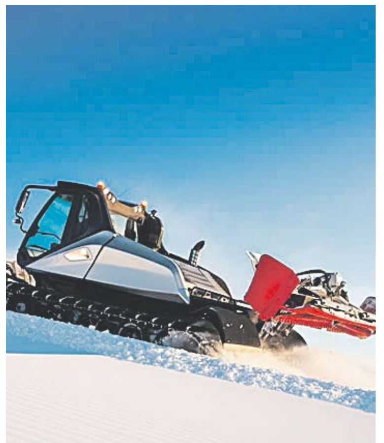
Nova trepitjaneu Leitwolf 2016, amb 510 cv de potència.

Com un més dels canvis que estem introduint a la nostra estació, us volem fer arribar, d'una manera directa, informació sobre el que fem a Arcalís per seguir millorant l'experiència dels nostres clients, sobre les novetats i també sobre el funcionament intern de l'estació. Pel que fa als resultats de la temporada 2014-2015, reflecteixen un període de canvi que va començar tot just fa un any. Tot i les dificultats d'un començament sense neu que va minvar els nostres ingressos, hem aconseguit millorar les xifres principals de l'estació i us en volem fer partícips. Amb 122 dies d'obertura, l'ocupació global baixa un 3,4%, però l'ocupació per dia puja un 11,5% i la facturació de la temporada, un 4,3%. El resultat d'explotació propi de SECNOA SAU, abans d'amortitzacions i cànon, ha millorat en 950.000 euros, més d'un 48%.