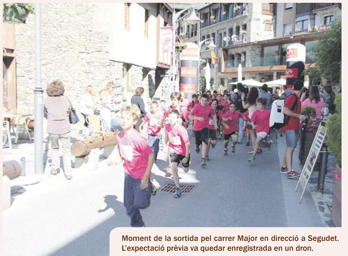
Moment de la sortida pel carrer Major en direcció a Segudet. L'expectació prèvia va quedar enregistrada en un dron.