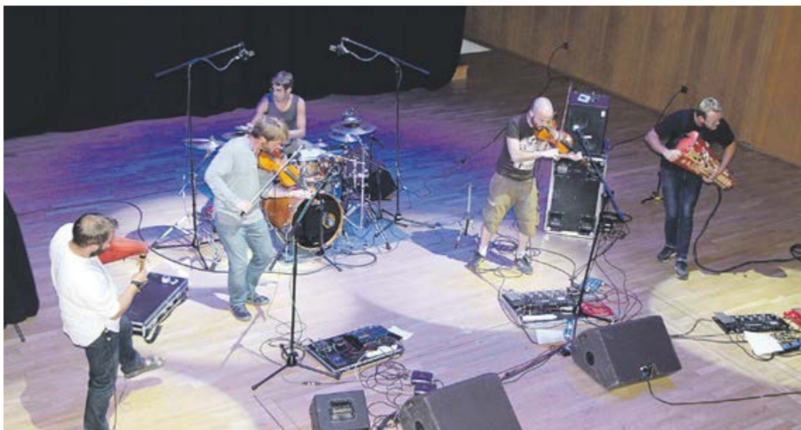
A dalt, a l'esquerra, directe dels Faburden a l'Auditori Nacional. A dalt, a la dreta, el duet Bellón Maceiras a la sala La Buna. A baix, El Pont d'Arcalís a la plaça Major.