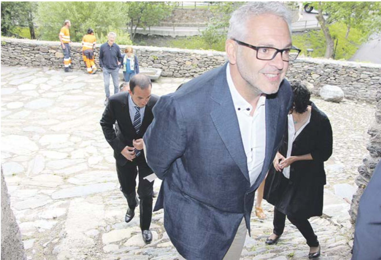
En primer pla, el cònsol major, Ventura Espot, seguit de les autoritats entrant a Casa Rossell.