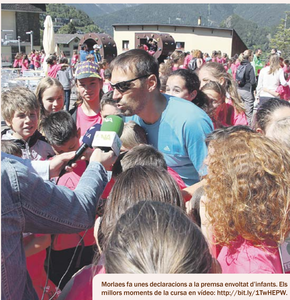
Morlaes fa unes declaracions a la premsa envoltat d'infants. Els millors moments de la cursa en vídeo: http://bit.ly/1TwHEPW .