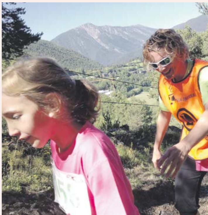
Pares i col·laboradors van fer el seguiment durant el recorregut al bosc de l'Esquella, que té un mirador sobre el poble d'Ordino.