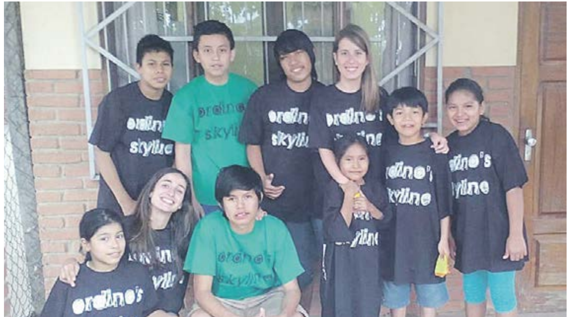
Voluntaris i infants mostren les samarretes que els va enviar el CEO a través de Cooperand.