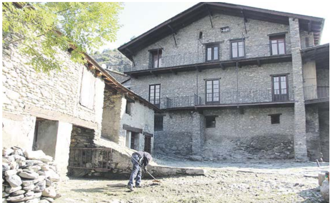
A dalt, el cap de Govern, en el parlament d'inauguració amb els cònsols d'Ordino i la ministra de Cultura. A baix, el personal de manteniment ultima l'adequació dels exteriors de la Casa.