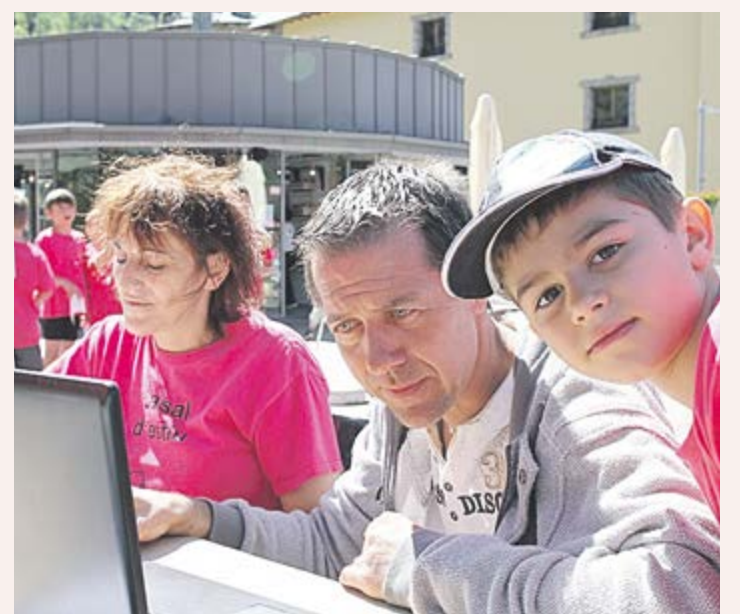
Diferents departaments del Comú d'Ordino van col·laborar en la logística de la prova, com ara el cronometratge.