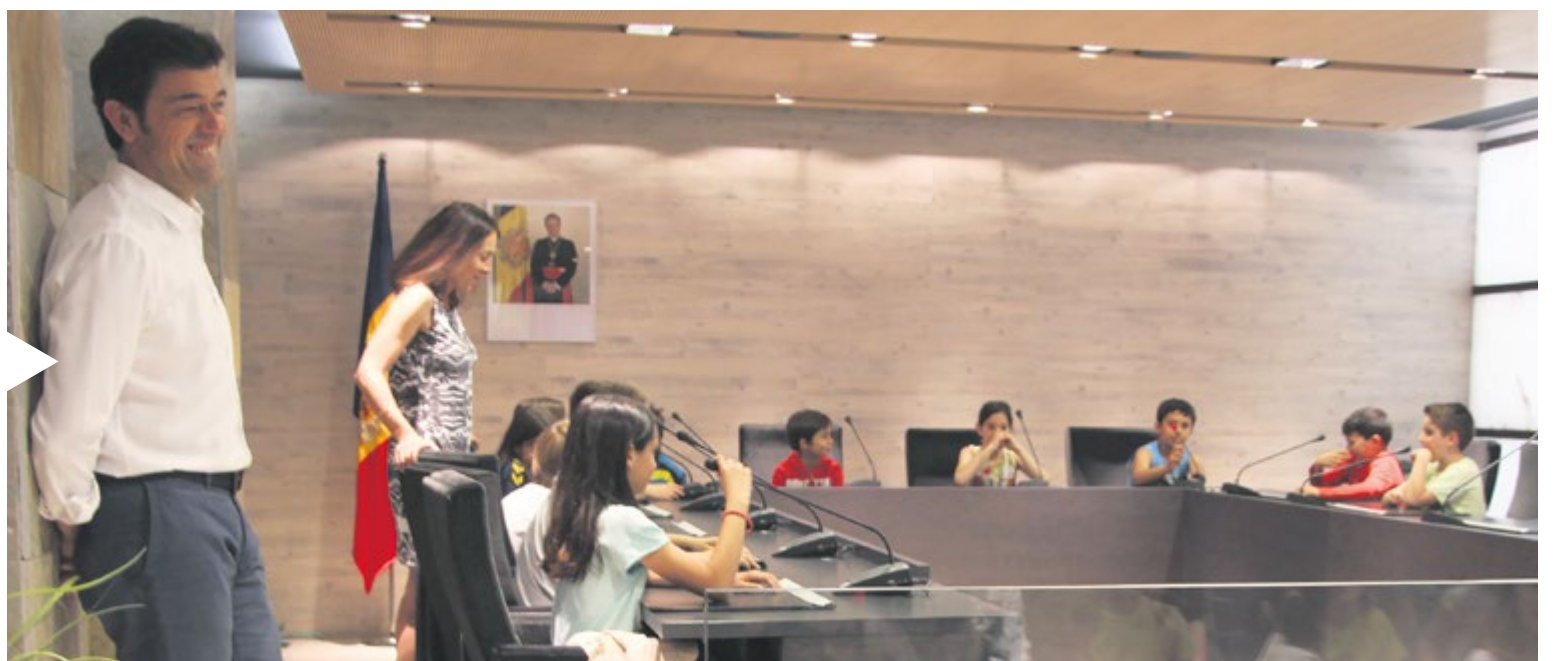
VISITA ESCOLAR Els cònsols van respondre les preguntes i les inquietuds dels alumnes de l'Escola Francesa durant la seva visita a les dependències comunals.