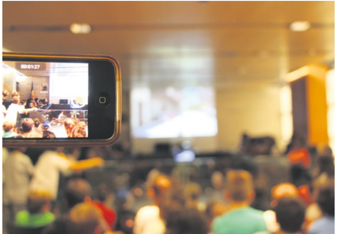
La sessió del Consell d'Infants en què es va presentar el vídeo per compartir a les xarxes.

Quant al medi ambient, els joves van plantejar l'ús de les bicicletes elèctriques com a