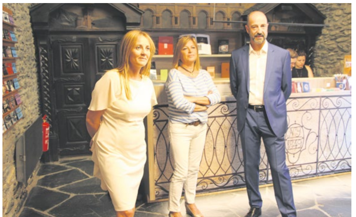
La ministra Gelabert amb la directora de Cultura, Montserrat Planellas, i el conseller Herver.

La inauguració es preveu per a mitjan setembre, i coincidirà amb les Jornades Europees de Patrimoni que se celebren arreu del continent, a Andorra del 14 al 17 de setembre. Es donarà entrada lliure als museus i monuments i serà el moment de descobrir aquest nou espai expositiu a Ordino.