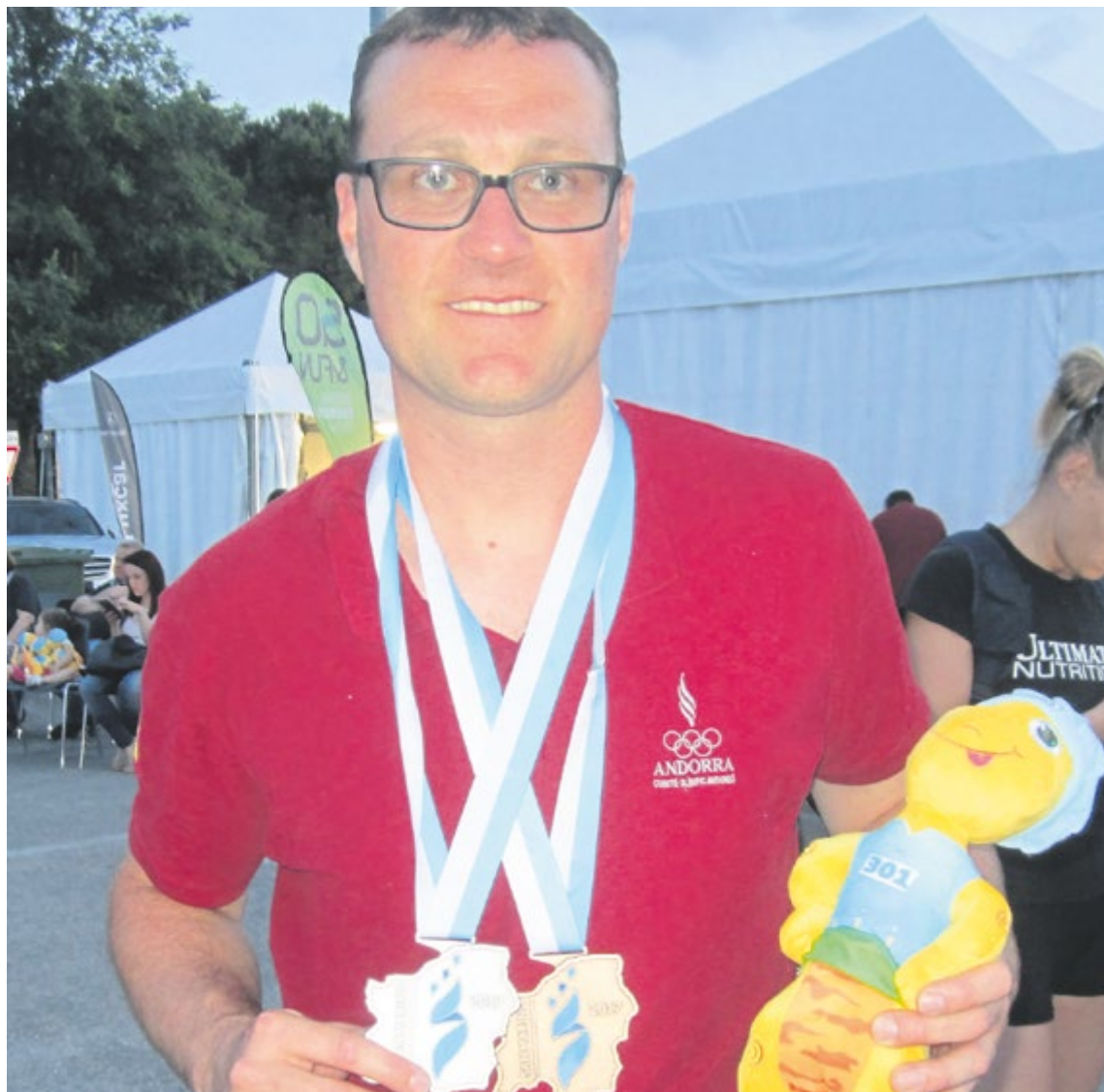
Breton mostra les dues medalles guanyades a San Marino.

En aquest temps ha davallat molt l'afició a totes les parròquies. En aquell moment, el 2007, hi havia sis clubs, i actualment en tenim quatre. El nostre principal problema és que només podem entrenar sis me-