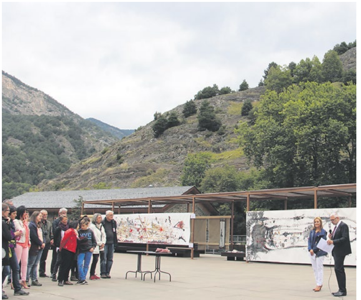
Cerimònia de cloenda de la primera edició d'Ordino Jardins d'Art, celebrada el 2015.