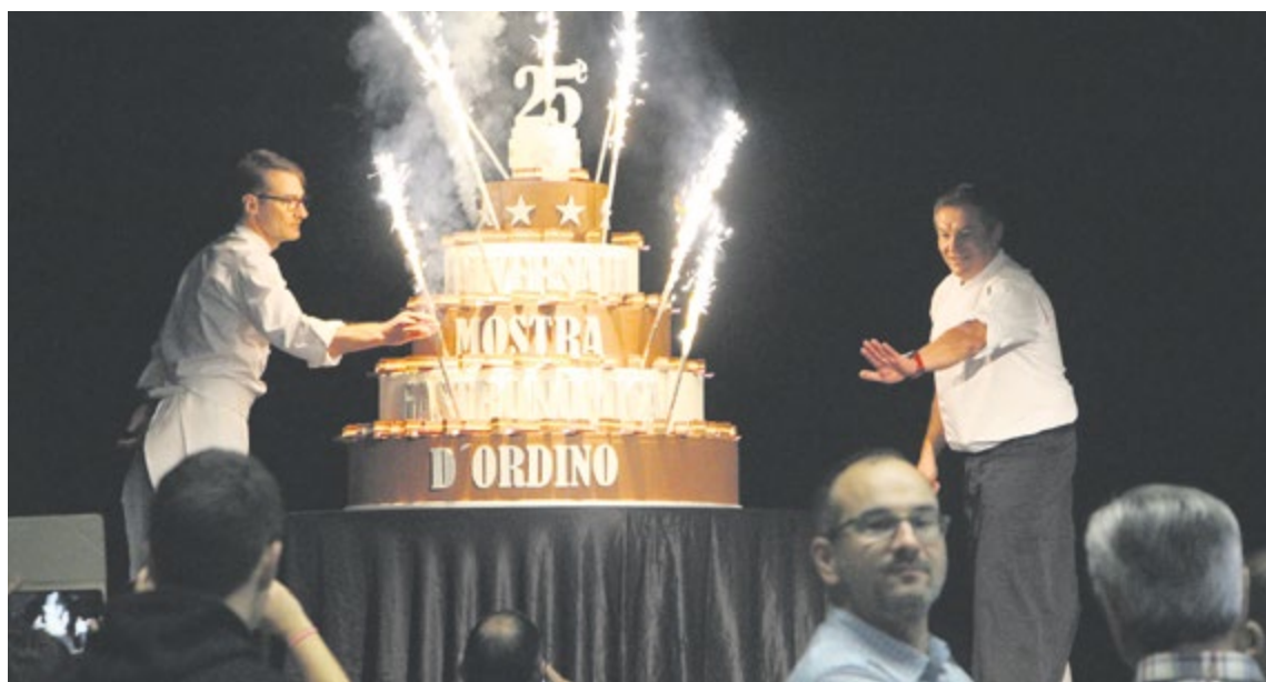
Pastís d'aniversari dels 25 anys de la Mostra Gastronòmica que es van celebrar l'any passat.

La Mostra se celebrarà el diumenge 12 de novembre en el format habitual i la venda anticipada de tiquets es farà a l'Oficina de Turisme i al Servei de Tràmits a un preu inferior al de taquilla. Els comensals podran tastar els menús presentats pels restauradors convidats a un preu únic, fins a esgotar-los. Els infants tindran un preu especial per potenciar l'àpat en-