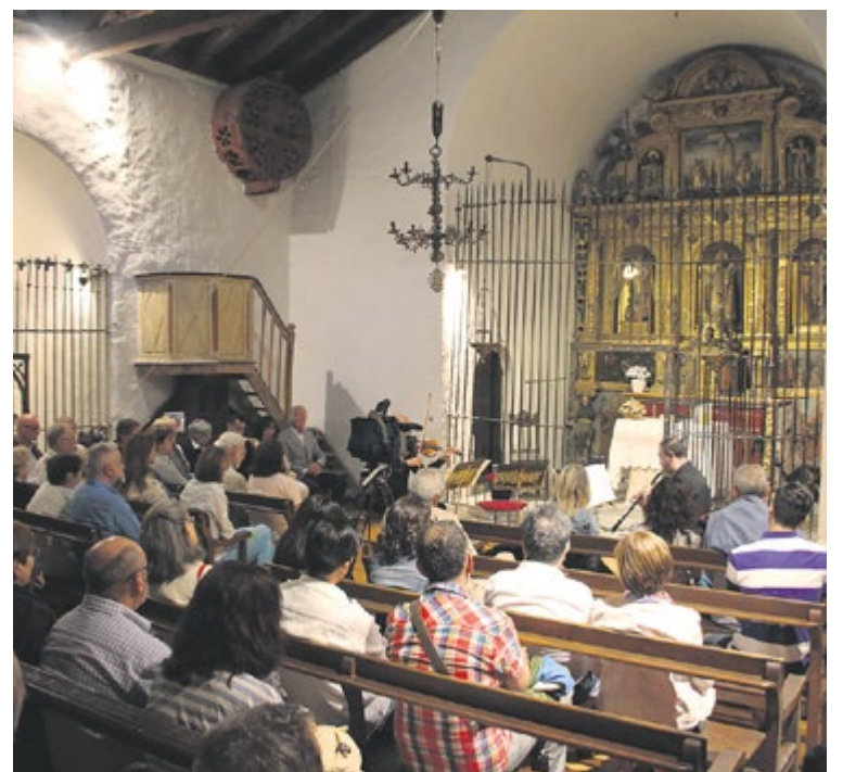
L'ONCA Bàsic a l'església de Sant Martí de la Cortinada.