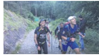
Sortida de l'#EUFÒRIA. Primera prova de l'#AUTV

269 m'agrada 24 compartits 14 comentaris 39