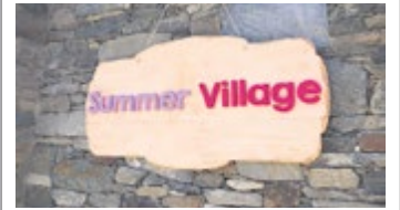
Benvinguts al Summer Village a Ordino

149 m'agrada 22 compartits 8 comentaris 7