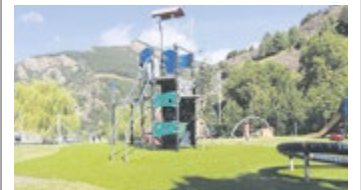
Així de maco ha quedat Prat de Call amb la nova gespa

97 m'agrada 12 compartits 4 comentaris 10 2