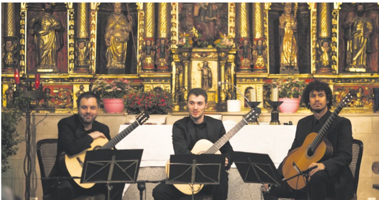
El Trío Desconcierto farà la segona actuació a l'església de Sant Corneli i Sant Cebrià.

- No és gaire habitual trobar als escenaris tres guitarres com a formació.