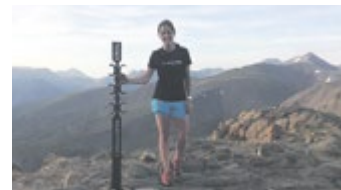
#ordinoestripages ja el trobes a #casamanya

149 m'agrada 22 compartits 8 comentaris 7