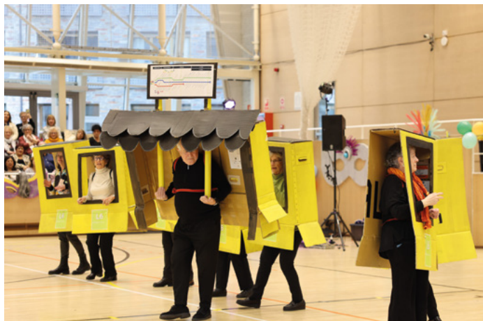
L'Associació de Gent Gran d'Ordino es va disfressar de la línia de bus L6 al carnaval interparroquial.

A banda d'aquesta qüestió, l'associació ha continuat participant activament en les activitats de la parròquia amb l'organització del Quinto de Nadal conjuntament amb l'Esbart Valls del Nord, ha col·laborat amb les activitats de la Casa Pairal i ha organitzat sortides per a la gent gran.