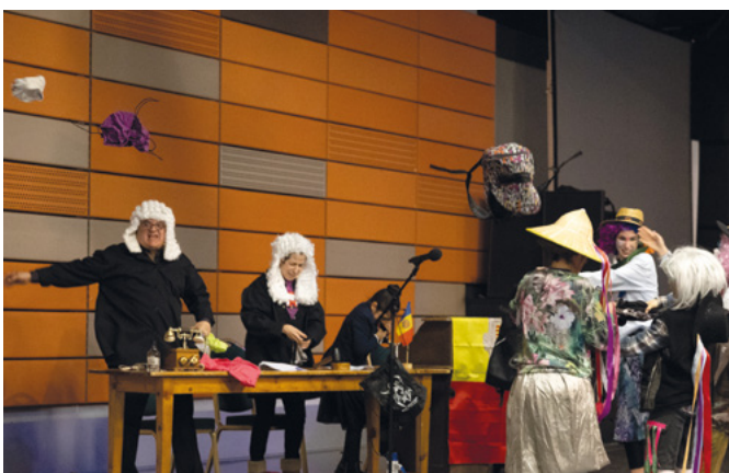
L'ACCO va acollir la representació dels Contrabandistes de l'Associació de Cultura Popular d'Ordino amb la col·laboració de l'Esbart Valls del Nord i la Coral Casamanya.