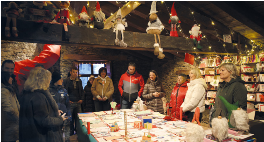
Les autoritats de la parròquia també van visitar la casa secreta del Pare Noel, una de les parades obligatòries del Cercle Màgic.

El Cercle Màgic ha tancat la seva primera edició amb un balanç clarament positiu, i ha estat una de les propostes familiars més destacades de l'hivern a la parròquia d'Ordino. Des de la seva posada en marxa a mitjan novembre i fins a finals de desembre, la iniciativa ha registrat una molt bona acollida, amb un total de 3.183 visitants que han participat en les diverses activitats programades.