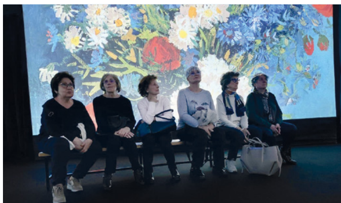
L'AGGO va organitzar una sortida per veure l'exposició de Van Gogh a Escaldes-Engordany.