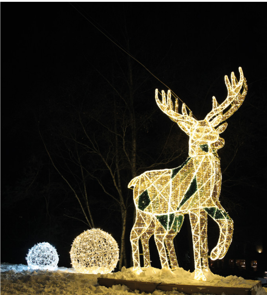
Les figures de llum han il·luminat el camí dels rens al camí Ral des de Llorts fins a la mina des del novembre i fins a mitjan febrer.

Entre les xifres sobresurten els 1.147 passaports venuts per accedir als diferents espais del recorregut, així com els 1.974 assistents a les audiències amb el Pare Noel, que han estat un dels grans reclams del projecte. També cal remarcar la participació en propostes com l'Acadèmia dels Menairons i les visites guiades, que han contribuït a enriquir l'experiència global i han estat un bon reclam per al turisme.