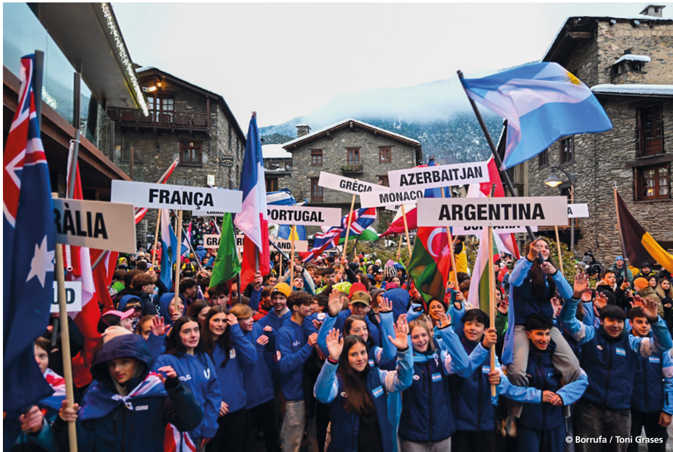
Els equips participants en el Trofeu Borrufa a la cerimònia d'inauguració a Ordino.

Andorra va tancar la 34a edició del Trofeu Borrufa amb un balanç positiu, ja que va assolir sis medalles i fins a catorze podis, malgrat les dificultats meteorològiques que van marcar la competició. Les condicions adverses van obligar a traslladar les proves previstes a Ordino Arcalís fins a la pista Esparver del sector El Tarter de Grandvalira, on finalment es van poder disputar les curses en categories U14 i U16, tant en masculí com en femení. Tot i aquests canvis, tant la cerimònia d'inauguració com la cloenda es van poder celebrar, com és habitual, a la plaça Major d'Ordino.