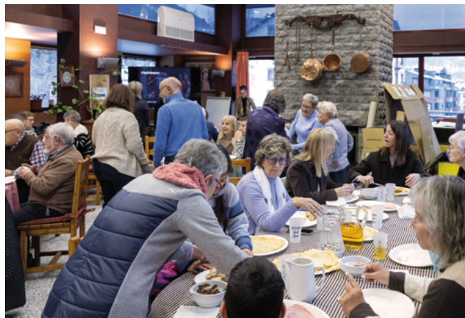
Per la Candelera, a la Casa Pairal es fan creps per berenar, que aquesta vegada van preparar membres de l'AGGO.