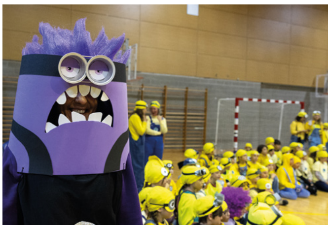
La desfilada dels col·legis es va fer al pavelló de les escoles Germans de Riba a causa del mal temps i es va omplir de mínions i animalons.

El mal temps va marcar el Carnaval d'Ordino, amb moltes activitats traslladades a espais interiors. Les escoles van celebrar la seva desfilada al pavelló, i la penjada del Carnestoltes es va poder fer amb música, ball i xocolatada popular a la plaça. La pluja, però, va portar la sàtira dels Contrabandistes sobre l'actualitat local i nacional a l'ACCO. La jornada es va completar amb el repartiment de brou i un ball de disfresses infantil. El Carnaval es va tancar amb la cremada del carnestoltes i la sardinada.