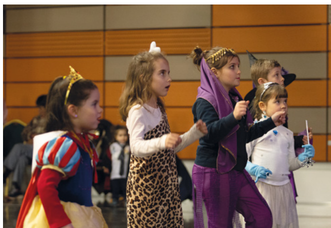
El ball de disfresses per als infants també es va traslladar de la plaça a l'ACCO.