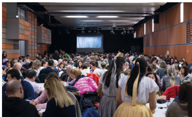
El Quinto de Nadal organitzat l'onze de gener va tornar a ser tot un èxit amb l'ACCO ple de gom a gom.