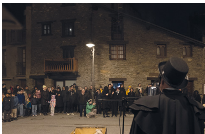
Finalment l'enterrament del Carnestoltes va tenir lloc a la plaça Major. Acte final del Carnaval organitzat per l'Associació de Cultura Popular d'Ordino amb la col·laboració dels Grallers i tabalers dels Castellers d'Andorra.