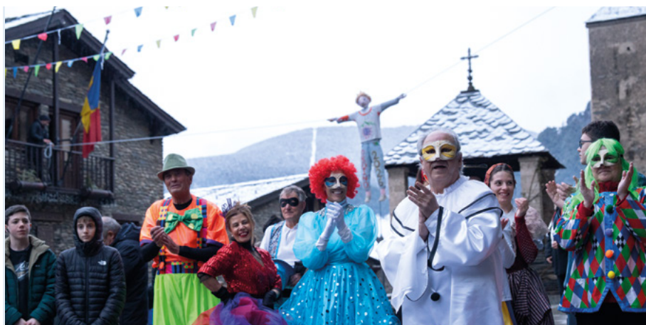
L'Associació de Cultura Popular d'Ordino, l'Esbart Valls del Nord, els Grallers i tabalers dels Castellers d'Andorra i el PIJ van fer possible la penjada del Carnestoltes.

El mal temps va marcar el Carnaval d'Ordino, amb moltes activitats traslladades a espais interiors. Les escoles van celebrar la seva desfilada al pavelló, i la penjada del Carnestoltes es va poder fer amb música, ball i xocolatada popular a la plaça. La pluja, però, va portar la sàtira dels Contrabandistes sobre l'actualitat local i nacional a l'ACCO. La jornada es va completar amb el repartiment de brou i un ball de disfresses infantil. El Carnaval es va tancar amb la cremada del carnestoltes i la sardinada.