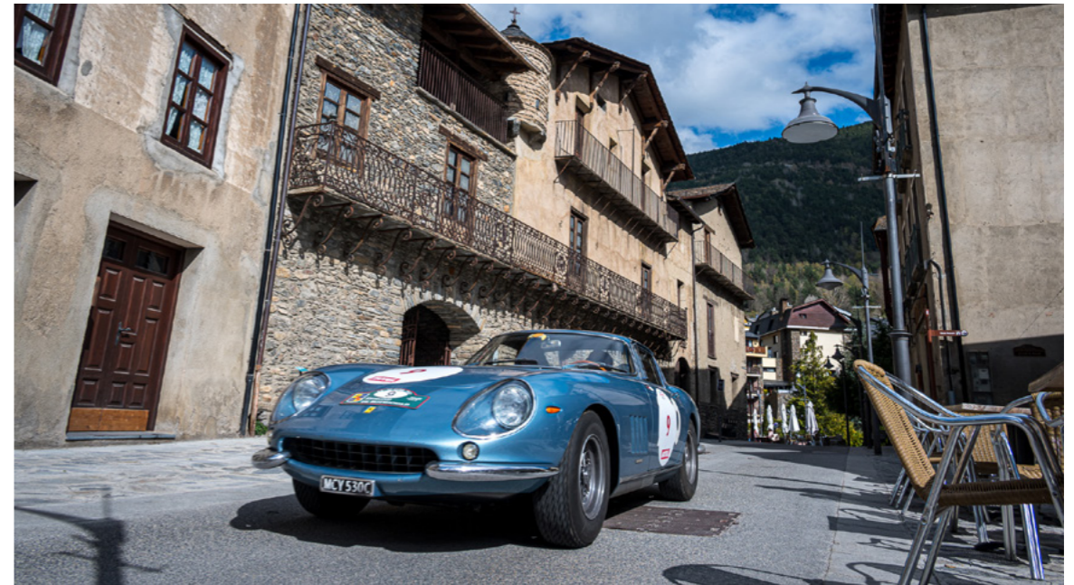
El pas dels vehicles per Ordino, després de recórrer França durant una setmana, sortint de la capital, va deixar imatges memorables, com la d'aquest Ferrari i altres clàssics esportius travessant el carrer Major.