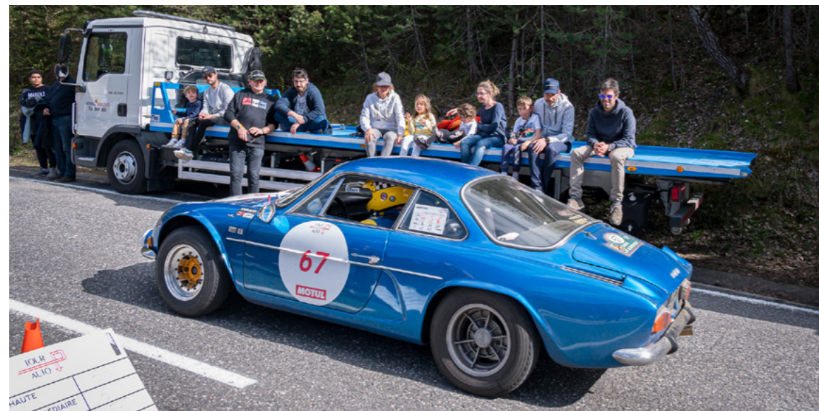
El tram cronometrat a la carretera del Coll d'Ordino va aixecar l'expectació de seguidors i curiosos, que volien veure models únics, com aquest Alpine de la marca Renault.