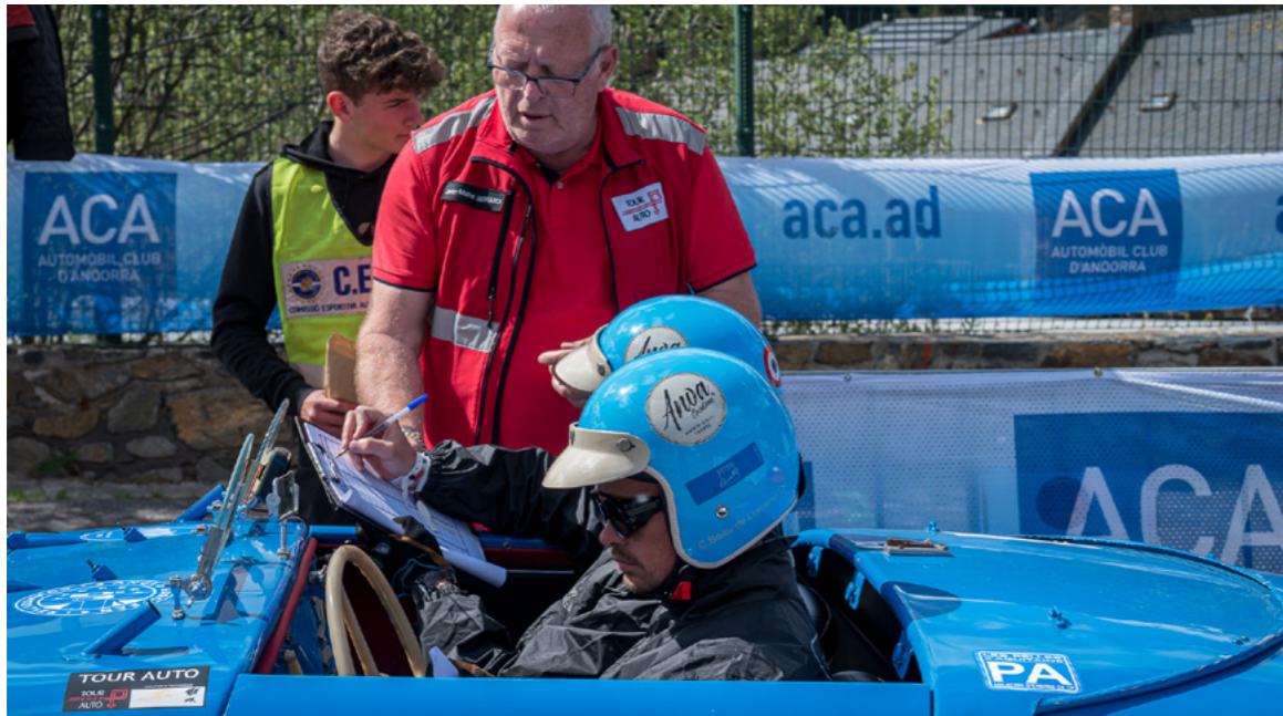
Els participants en el mític ral·li Tour Auto van fer un reagrupament al camp de la Tanada. A la foto es pot veure el control de l'arribada dels vehicles per part d'un membre de l'ACA, organitzador de la prova.