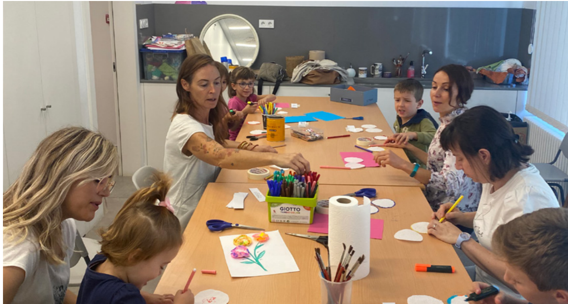
Persones de totes les edats van participar en tres tallers que es van fer durant la jornada de portes obertes de La Capsa. N'hi va haver un de fotografia, un de plàstica i un joc d'improvisació.