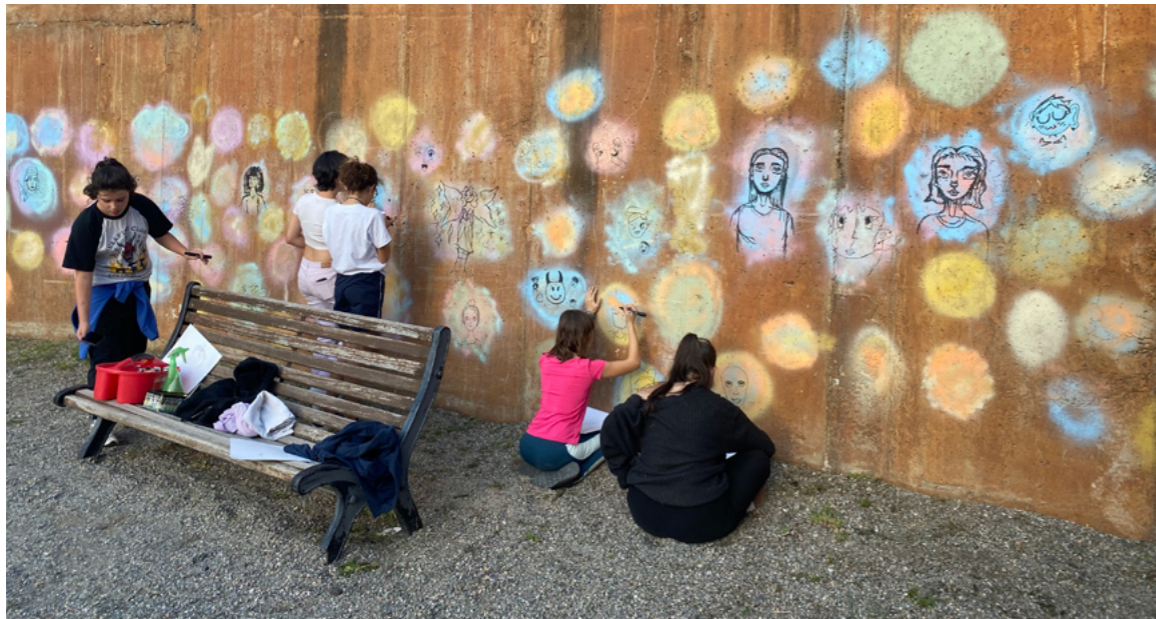
Una de les activitats més participatives va ser la pintura d'un mural col·lectiu al camp de petanca de la Covanella. La sanefa de retrats de la diversitat tindrà continuïtat.