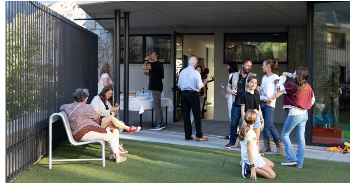
La Jornada de portes obertes a La Capsa va ser un èxit i molta gent es va interessar per les propostes que s'hi fan. L'objectiu és donar a conèixer l'oferta i compartir experiències.