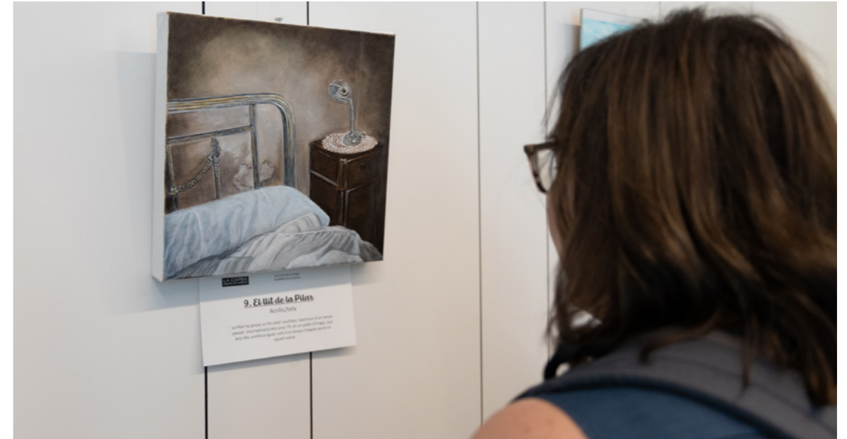
Durant la jornada també es va inaugurar la mostra «Els llits de la Isabel», un recull dels treballs dels alumnes de l'escola inspirats en la temàtica del llit en la història de l'art.