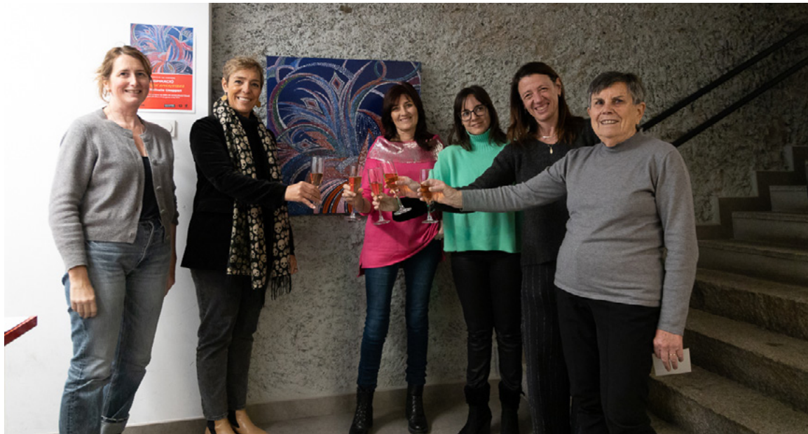
Brindis en la inauguració de la primera exposició de l'any, amb obres d'inspiració aborigen de l'artista francesa Nathalie Chappert, organitzada per La Capsa a l'edifici sociocultural L'Estudi.