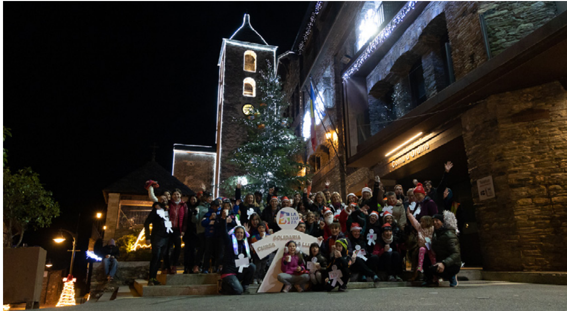
La marxa solidària i popular de La Llufa va recaptar una vuitantena de joguines per a la campanya de Reis. Ha estat una de les novetats del programa de Nadal d'aquest any.