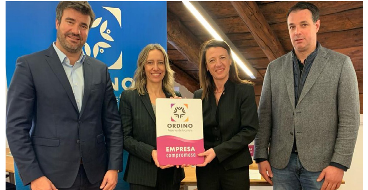
Morabanc, pels seus valors i les seves polítiques de sostenibilitat, primera entitat bancària de la parròquia que ha recollit el segell d'Empresa Compromesa amb la Reserva de la Biosfera de mans dels cònsols.